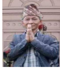
कस्वा बोहरा वडा अध्यक्ष वडा नं १ ०१/११/१९०१