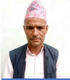
विरे धामी वडा अध्यक्ष वडा नं २ ०१/१३/२०/१५